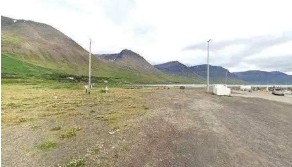
Flateyri harbor street view 360deg