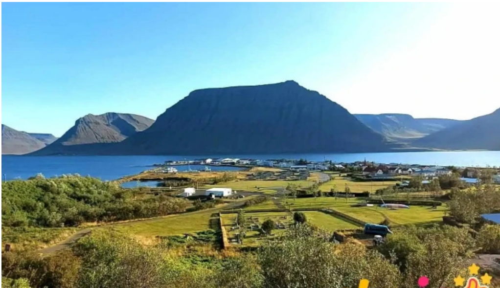
Flateyri harbor myndskaid