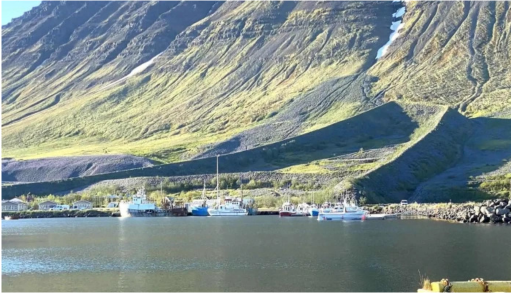
Flateyri harbor instagram