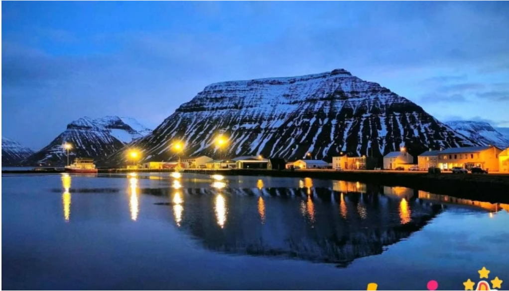
Flateyri harbor nyjast