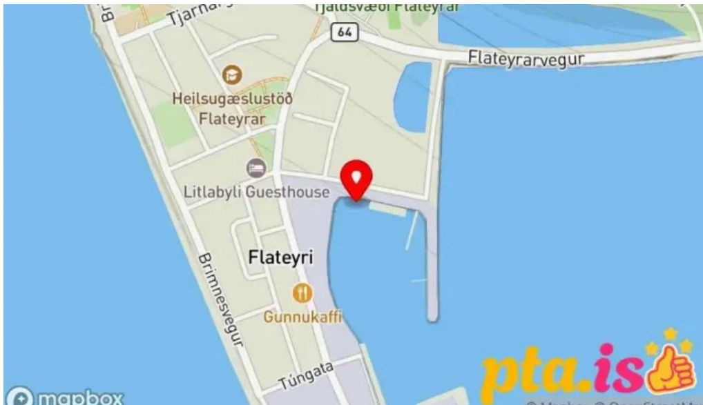
Flateyri harbor Kort