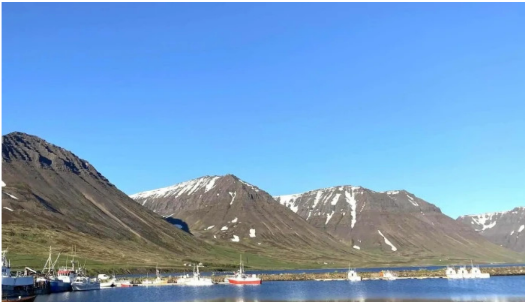
Flateyri harbor flateyri