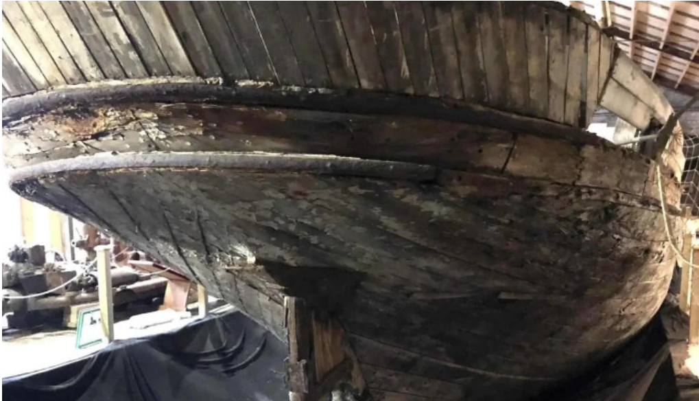
Skaffellingur museum vik