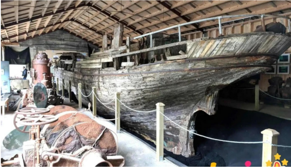
Skaffellingur museum sogusafn