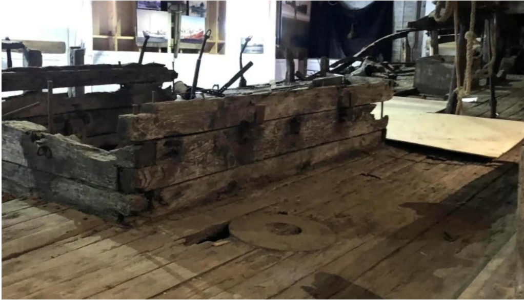
Skaffellingur museum vefsiða