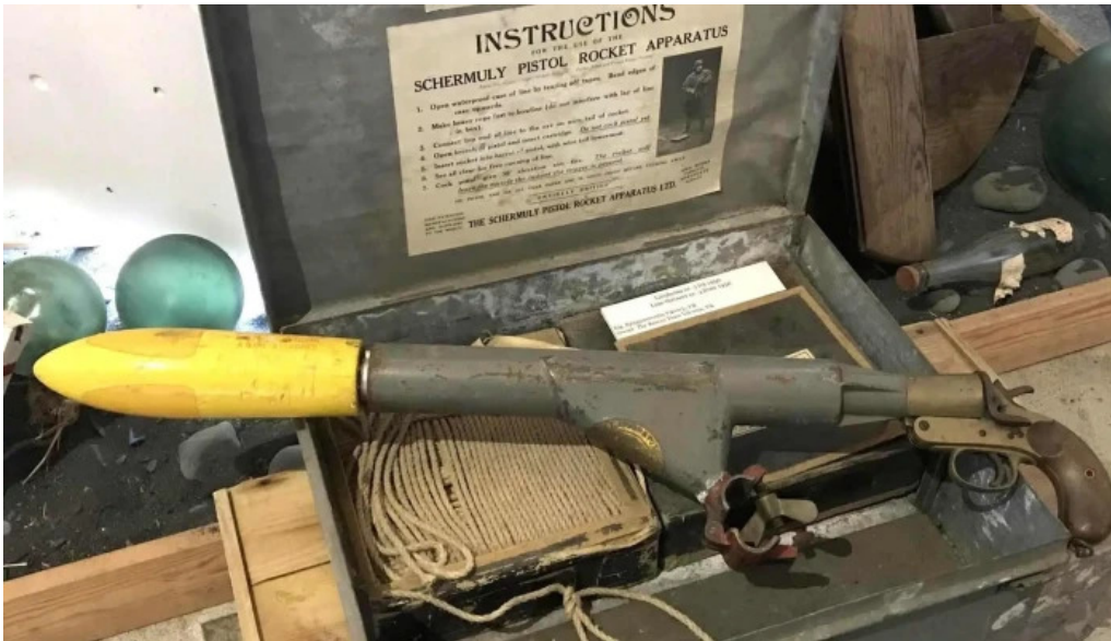
Skaffellingur museum instagram