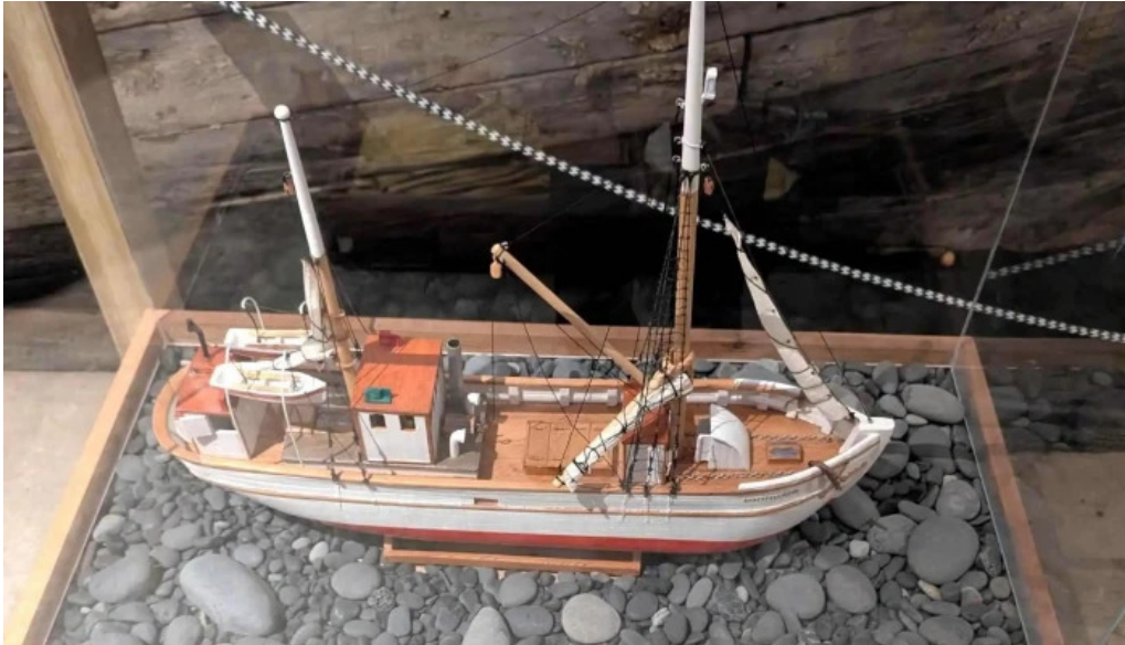
Skaffellingur museum afslættir