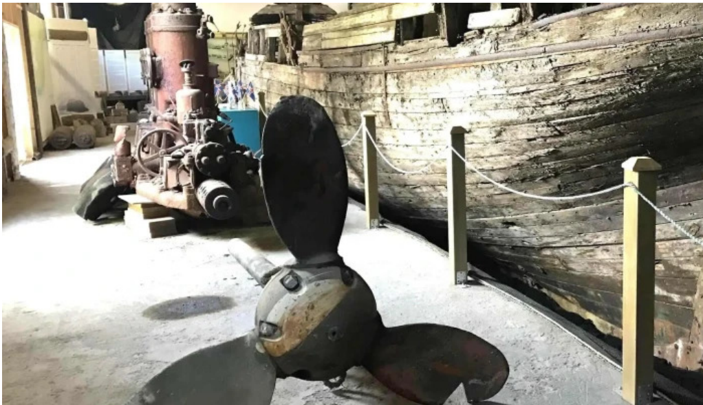
Skaffellingur museum svæði