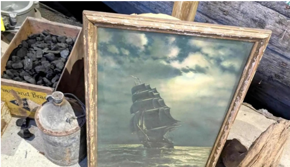
Skaffellingur museum heimilisfang