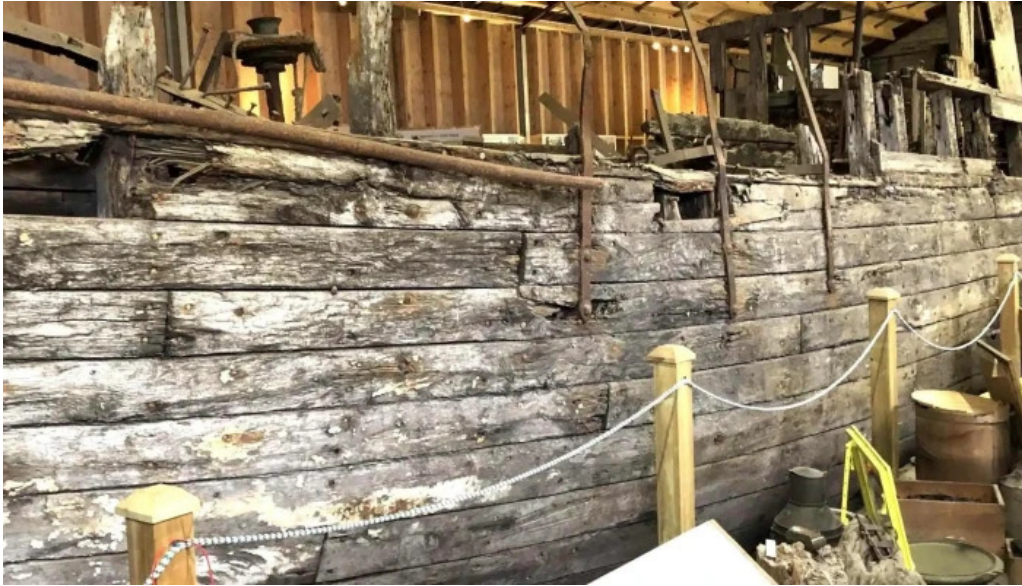
Skaffellingur museum einkunn