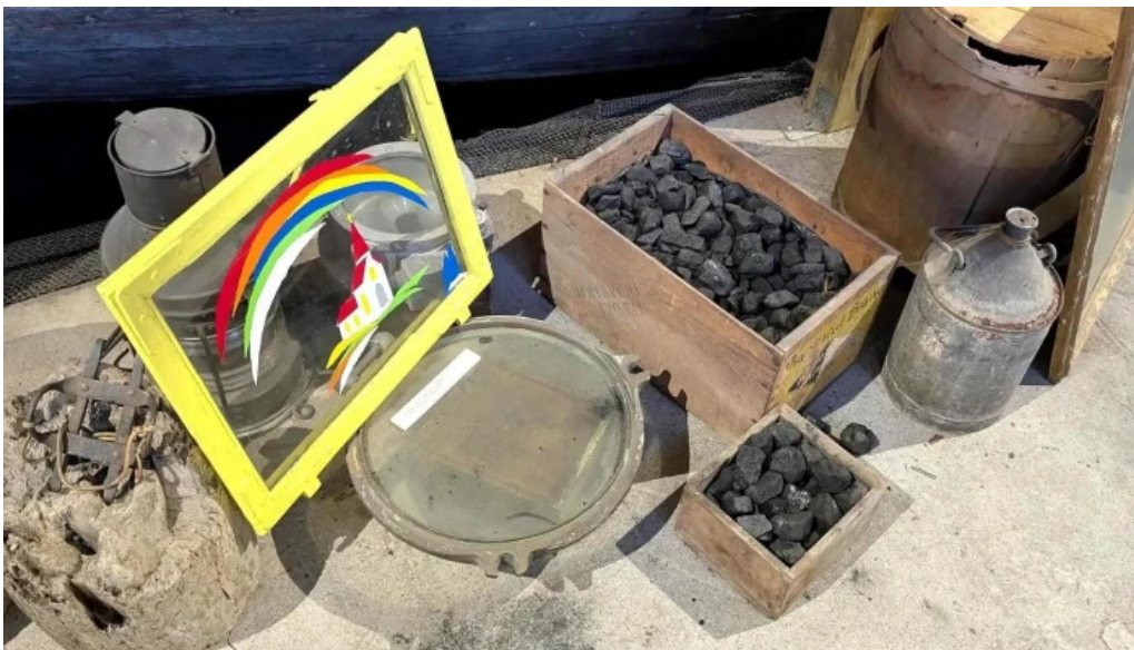
Skaffellingur museum verð