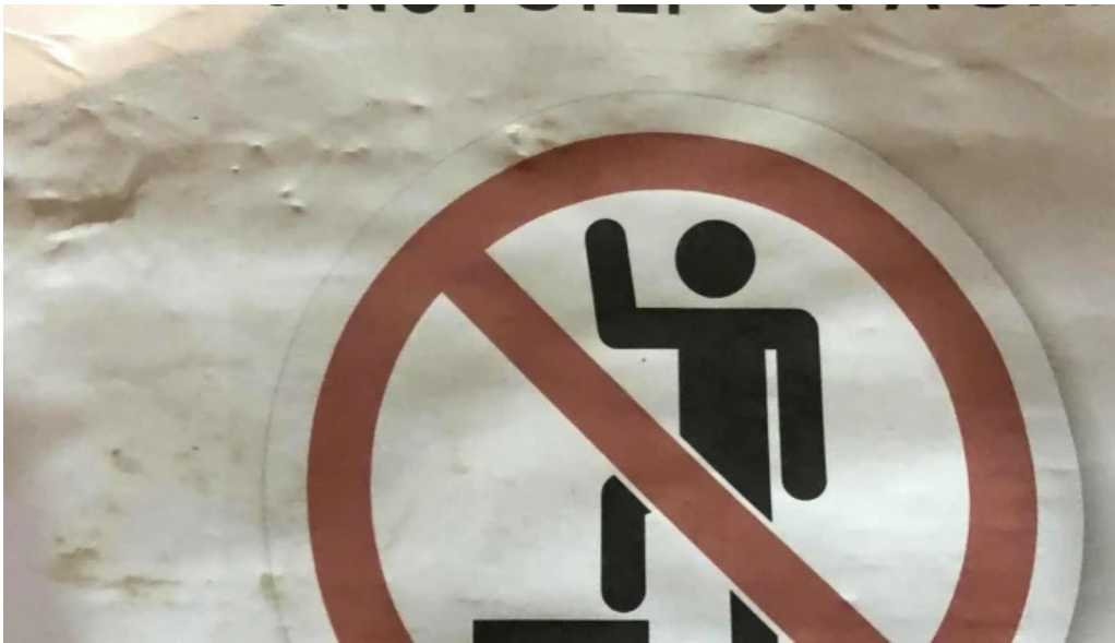
Skaffellingur museum athugasemdir